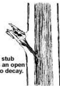
Leaving a stub maintains an open pathway to decay.

Grene i et træs krone producerer i tusindvis af blade for at optage sollys. Når bladene fjernes, er de resterende grene og stammen pludselig udsat for et højt niveau af både lys og varme. Resultatet kan være solskade på vævet under barken. Dette kan føre til skader såsom, revner i barken og døde grene.