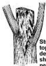
Stubs left from topping usually decay. The shoots that are produced below the cut are weakly attached, and often become a hazard.